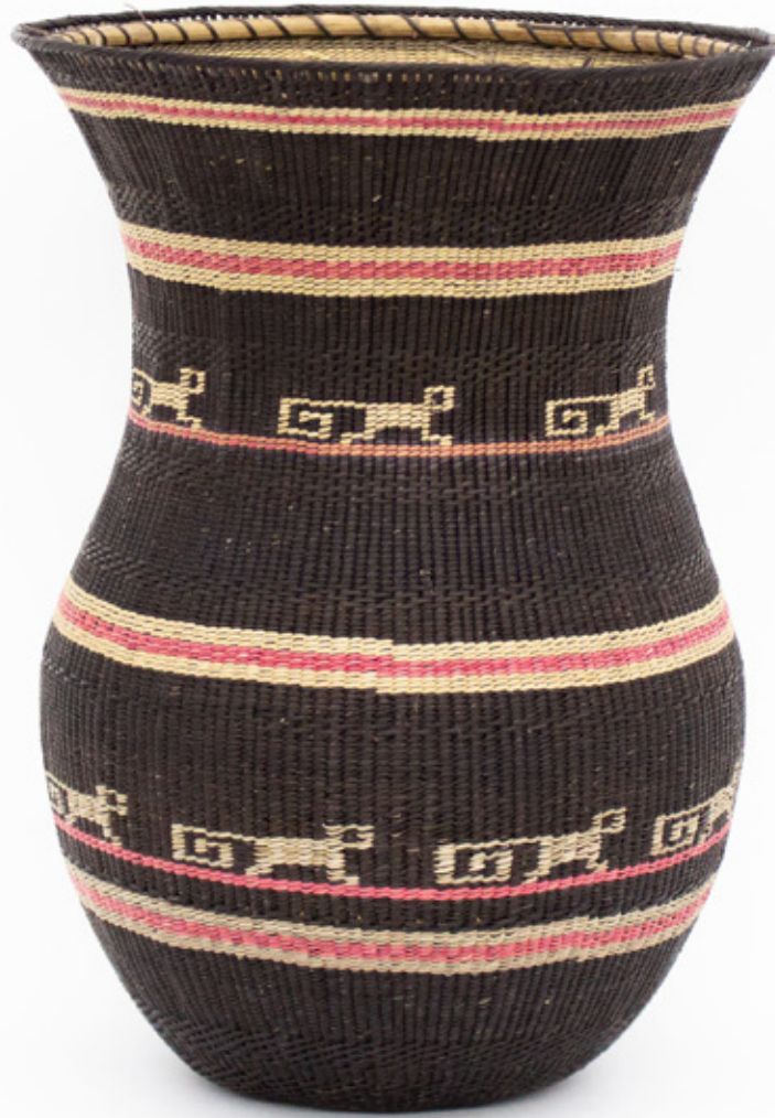
Wiwa , 2026. Tejido a mano, bejucos teñidos con tintes naturales. 33 x 23.5 cm.