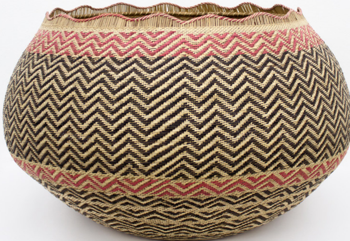
Jöjö , 2026. Tejido a mano, bejucos teñidos con tintes naturales. 46 x 53 cm.