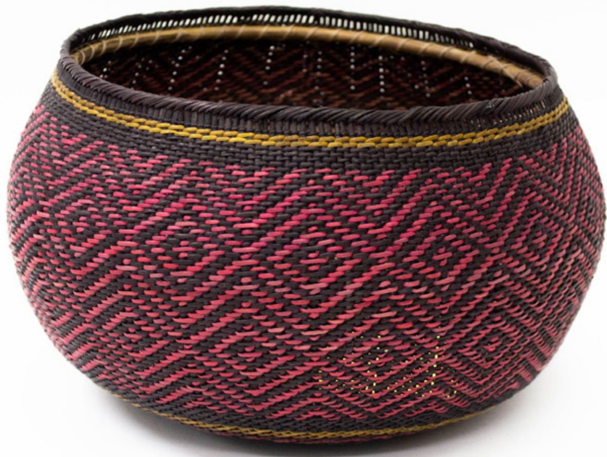
Jöjö , 2026. Tejido a mano, bejucos teñidos con tintes naturales. 15 x 27 cm. [No disponible]