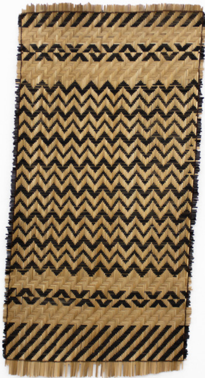
Shamaii / Tejer raíces , 2026. Tejido a mano, bejucos teñidos con tintes naturales. 107 x 53 cm.