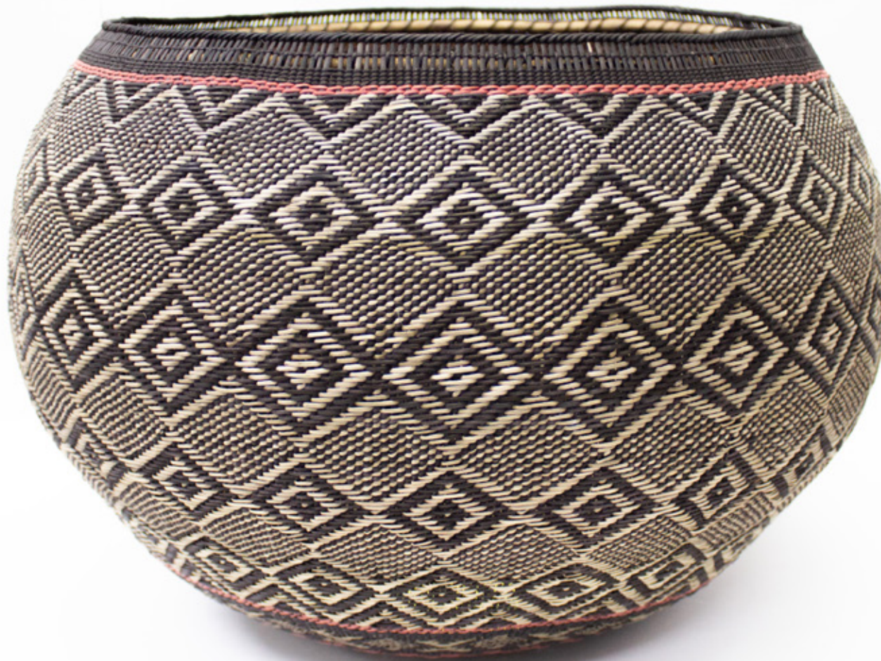
Jöjö, 2026. Tejido a mano, bejucos teñidos con tintes naturales. 30 x 41 cm.