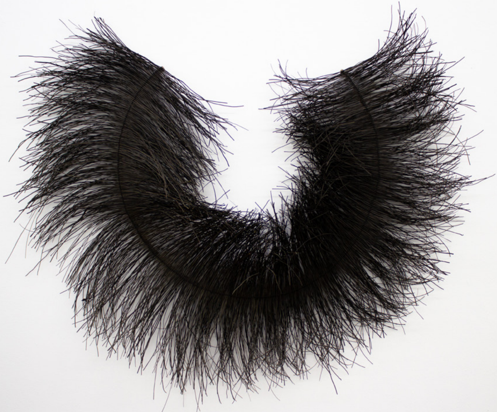
Yademodu / Alas , 2026. Tejido a mano, bejuco teñidos con tintes naturales. 135 x 166 cm.