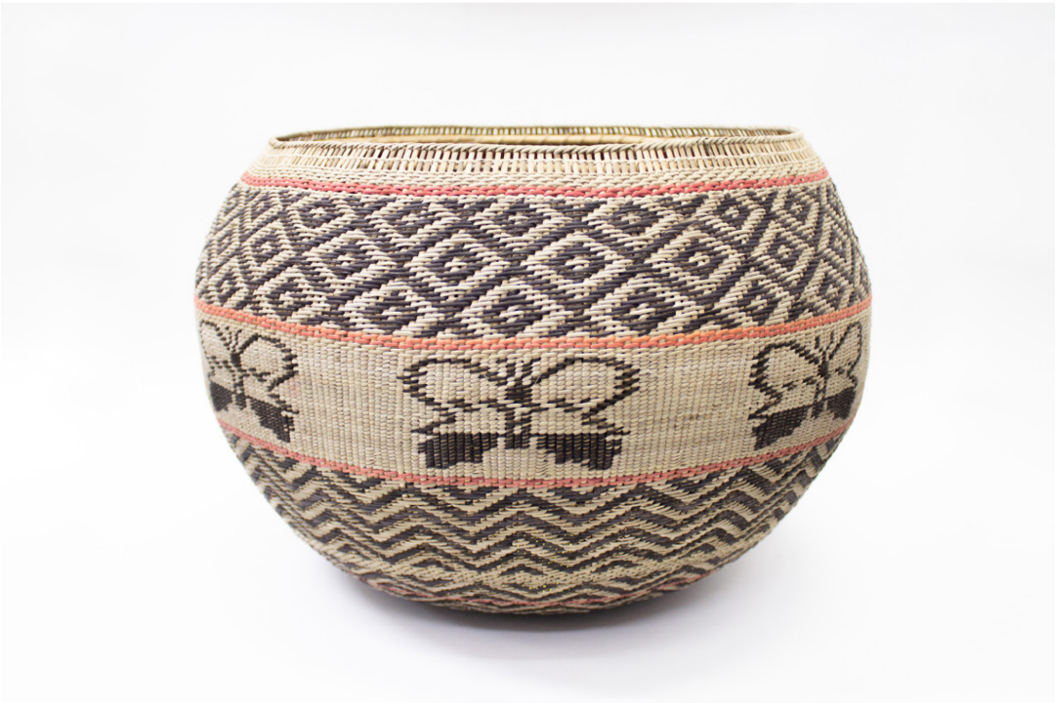
Jöjö, 2026. Tejido a mano, bejucos teñidos con tintes naturales. 28 x 43 cm.