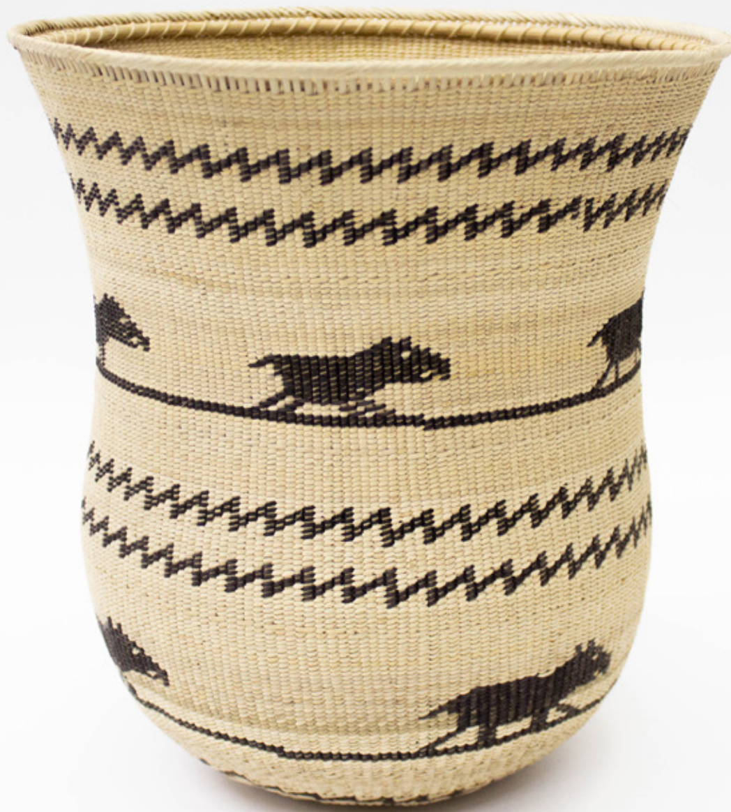
Wíwa, 2026. Tejido a mano, bejucos teñidos con tintes naturales. 24 x 22.5 cm. [No disponible]