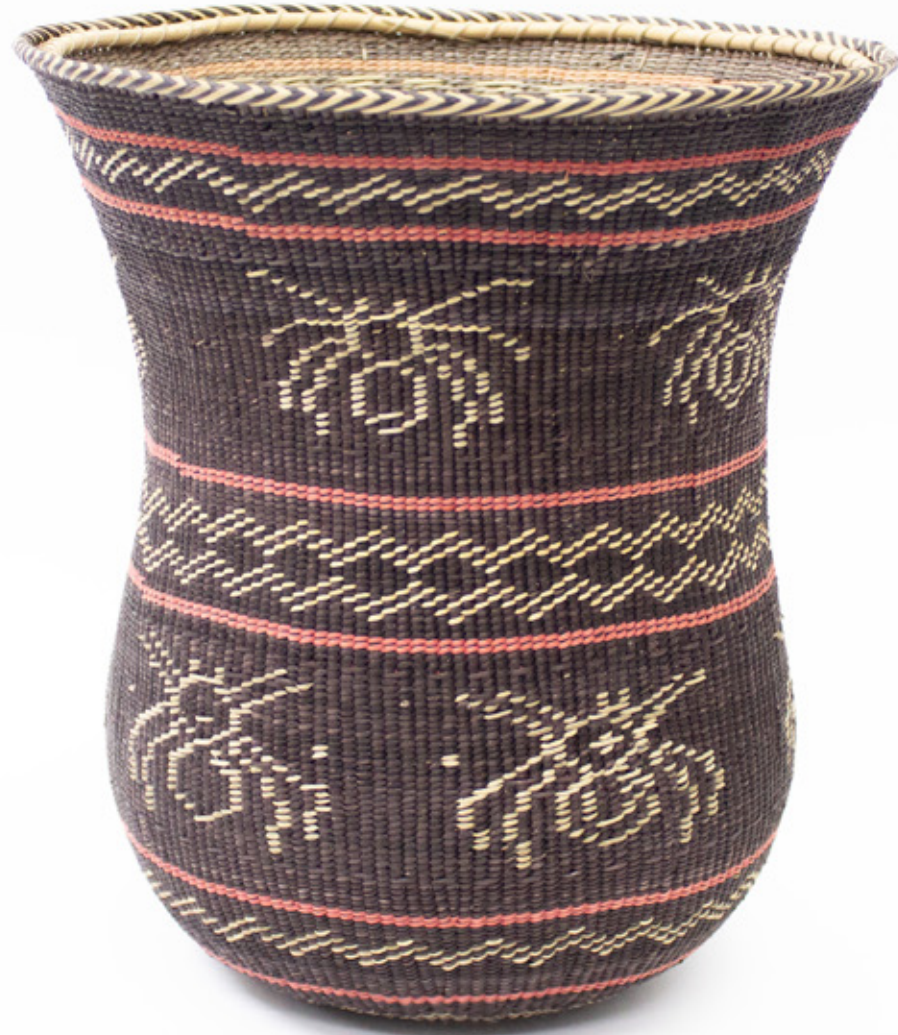
Wiwa, 2026. Tejido a mano, bejucos teñidos con tintes naturales. 24 x 22 cm.