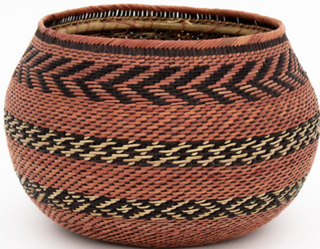
Jöjö , 2026. Tejido a mano, bejucos teñidos con tintes naturales. 15.5 x 19 cm.