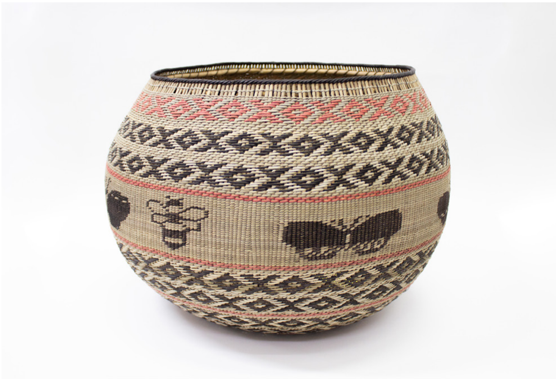
Jöjö, 2026. Tejido a mano, bejucos teñidos con tintes naturales. 28 x 39 cm.