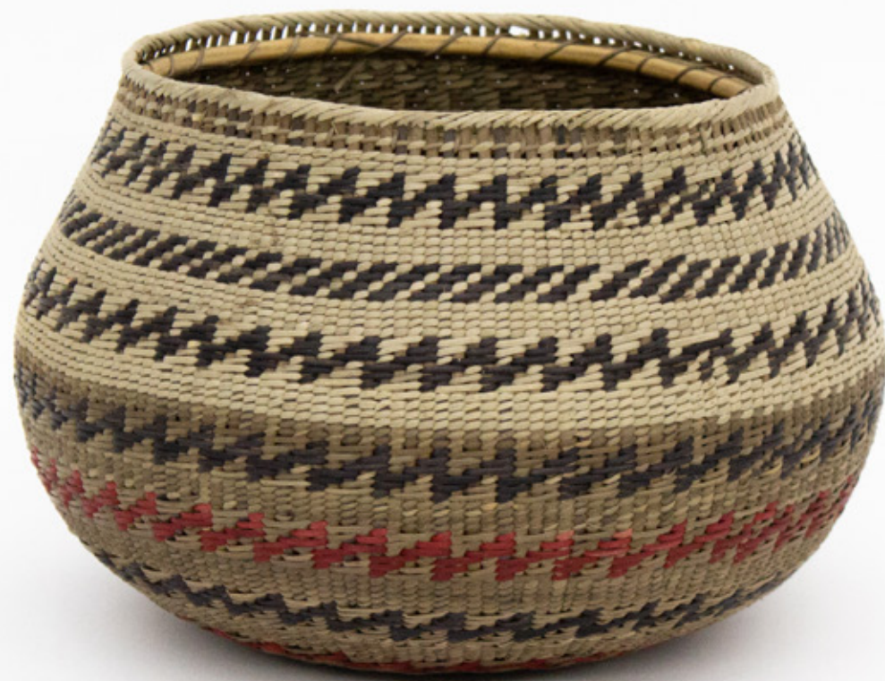
Jöjö, 2026. Tejido a mano, bejucos teñidos con tintes naturales. 14 x 16 cm. [No disponible]