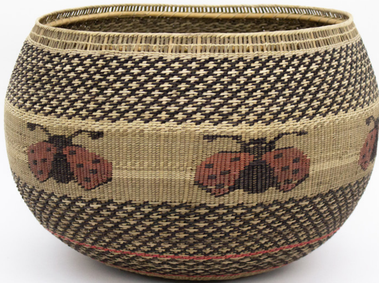
Jöjö , 2026. Tejido a mano, bejucos teñidos con tintes naturales. 26 x 34.5 cm.