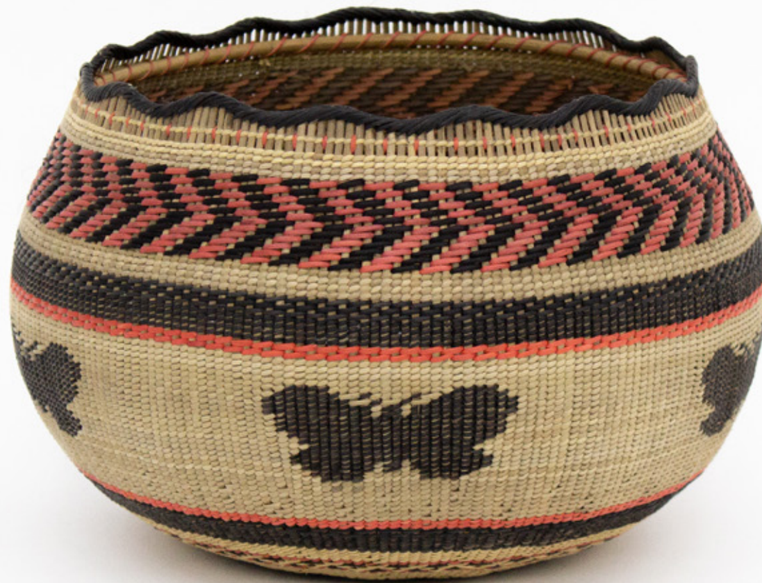
Jöjö, 2026. Tejido a mano, bejucos teñidos con tintes naturales. 16 x 19.5 cm.