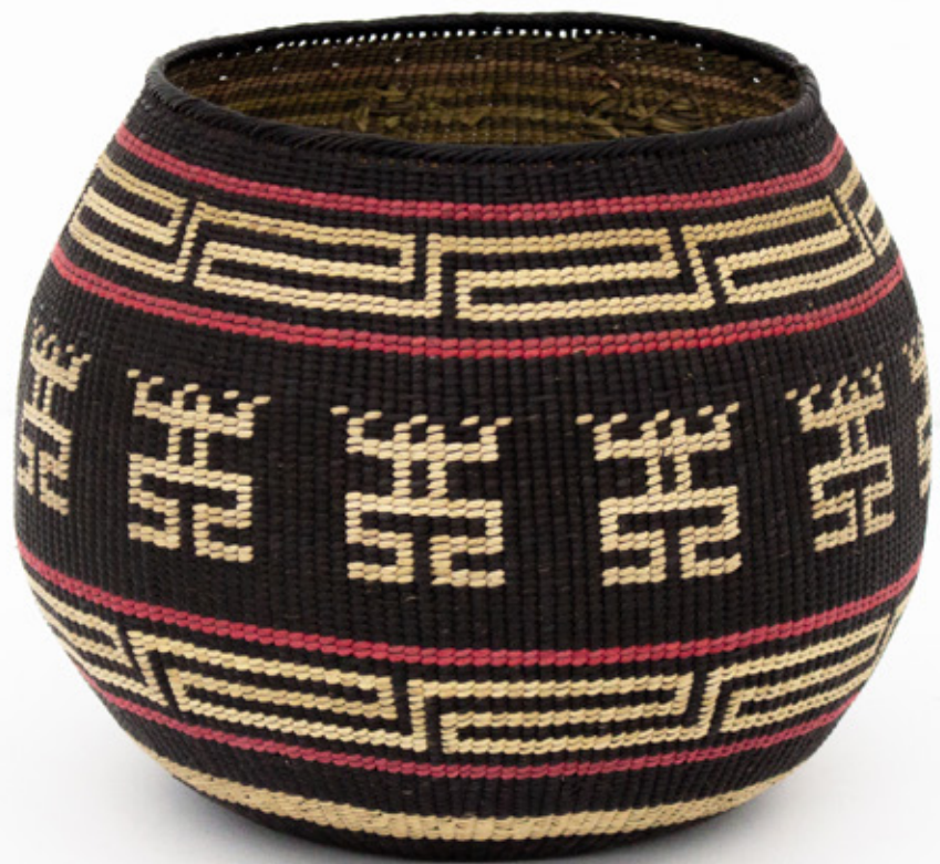
Jöjö, 2026. Tejido a mano, bejucos teñidos con tintes naturales. 17 x 15 cm.