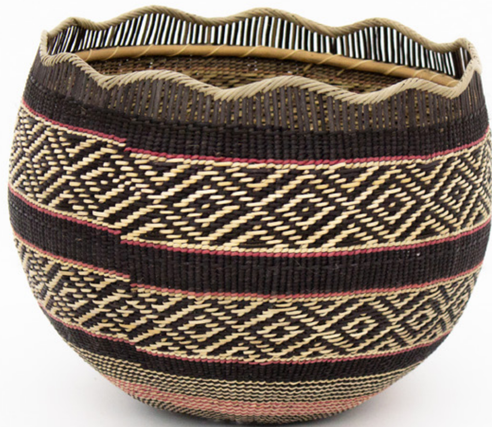
Jöjö , 2026. Tejido a mano, bejucos teñidos con tintes naturales. 20 x 23.5 cm.