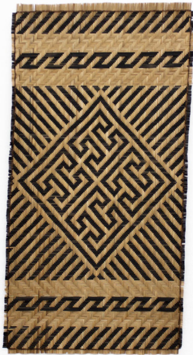
Shamaii / Tejer raíces , 2026. Tejido a mano, bejucos teñidos con tintes naturales. 107 x 53 cm.