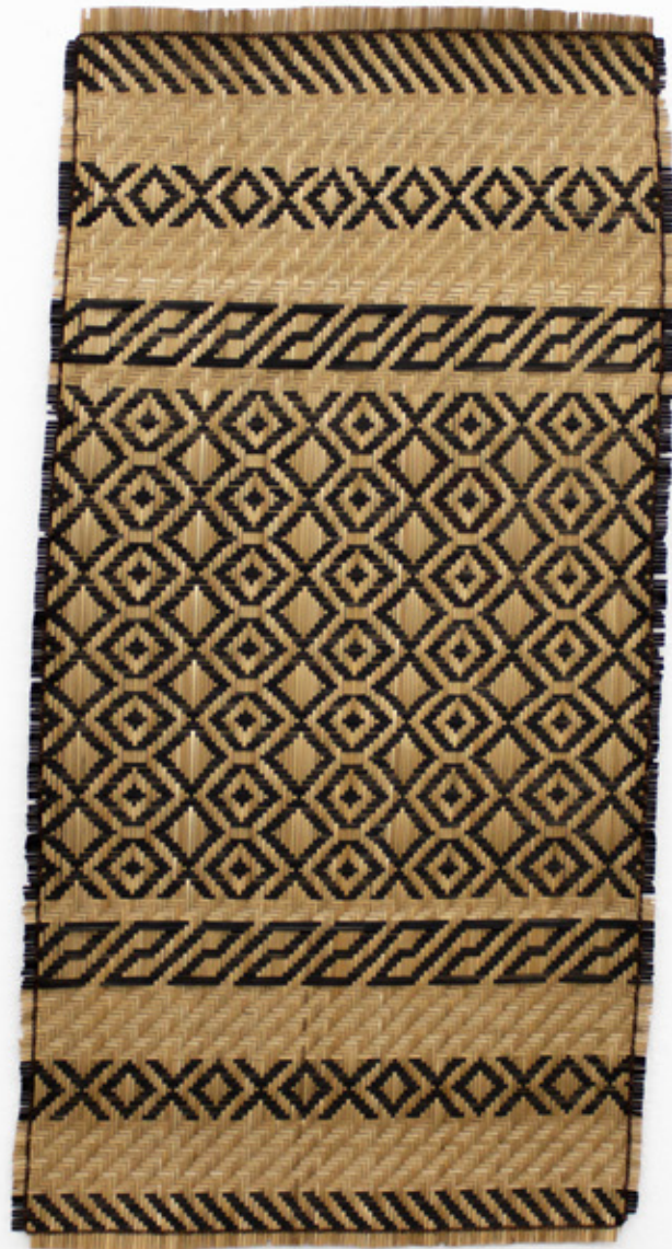
Shamaii / Tejer raíces , 2026. Tejido a mano, bejucos teñidos con tintes naturales. 107 x 53 cm.