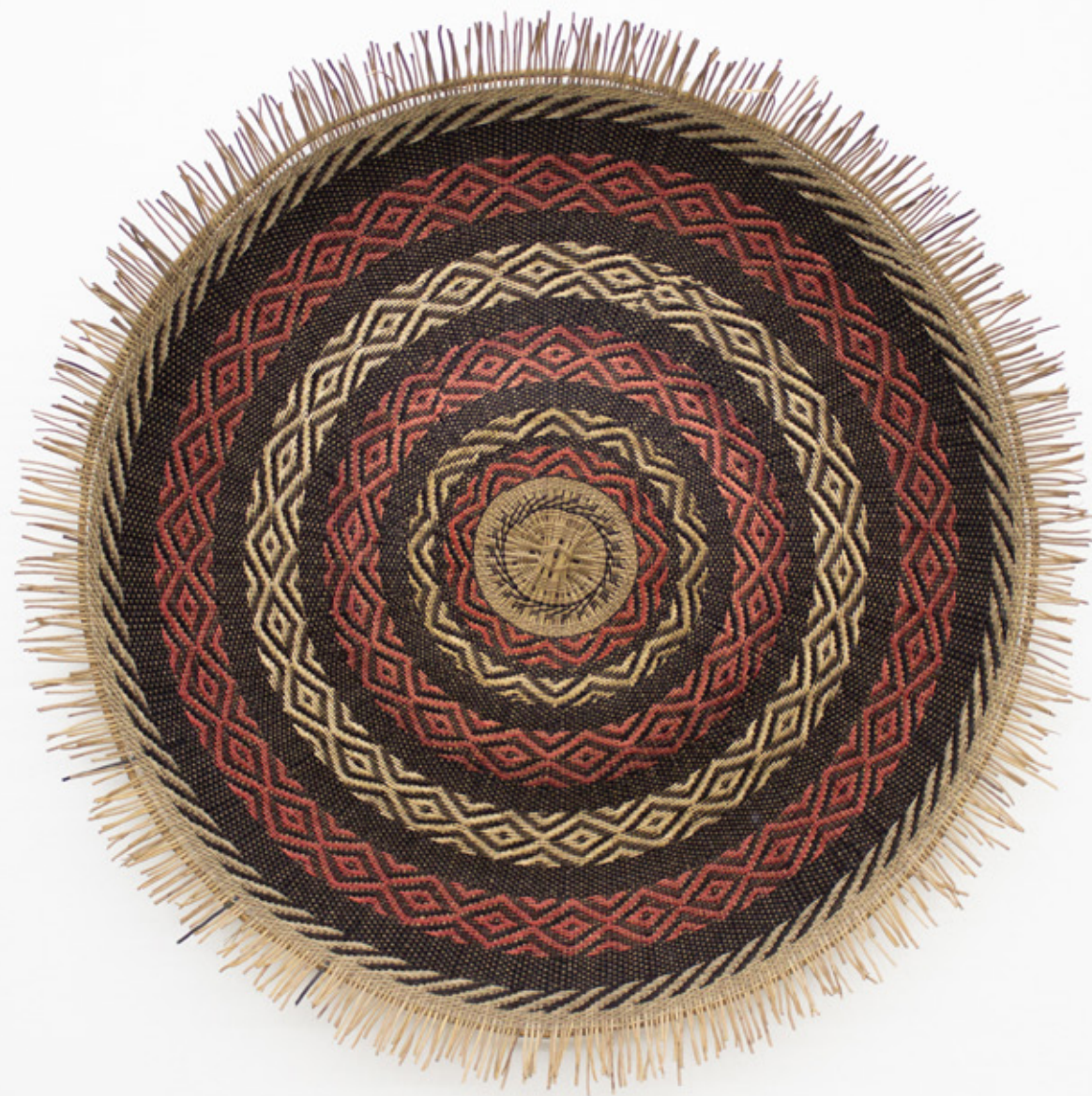
Sol / Shii , 2026. Tejido a mano, bejuco teñidos con tintes naturales. 107 cm Ø.