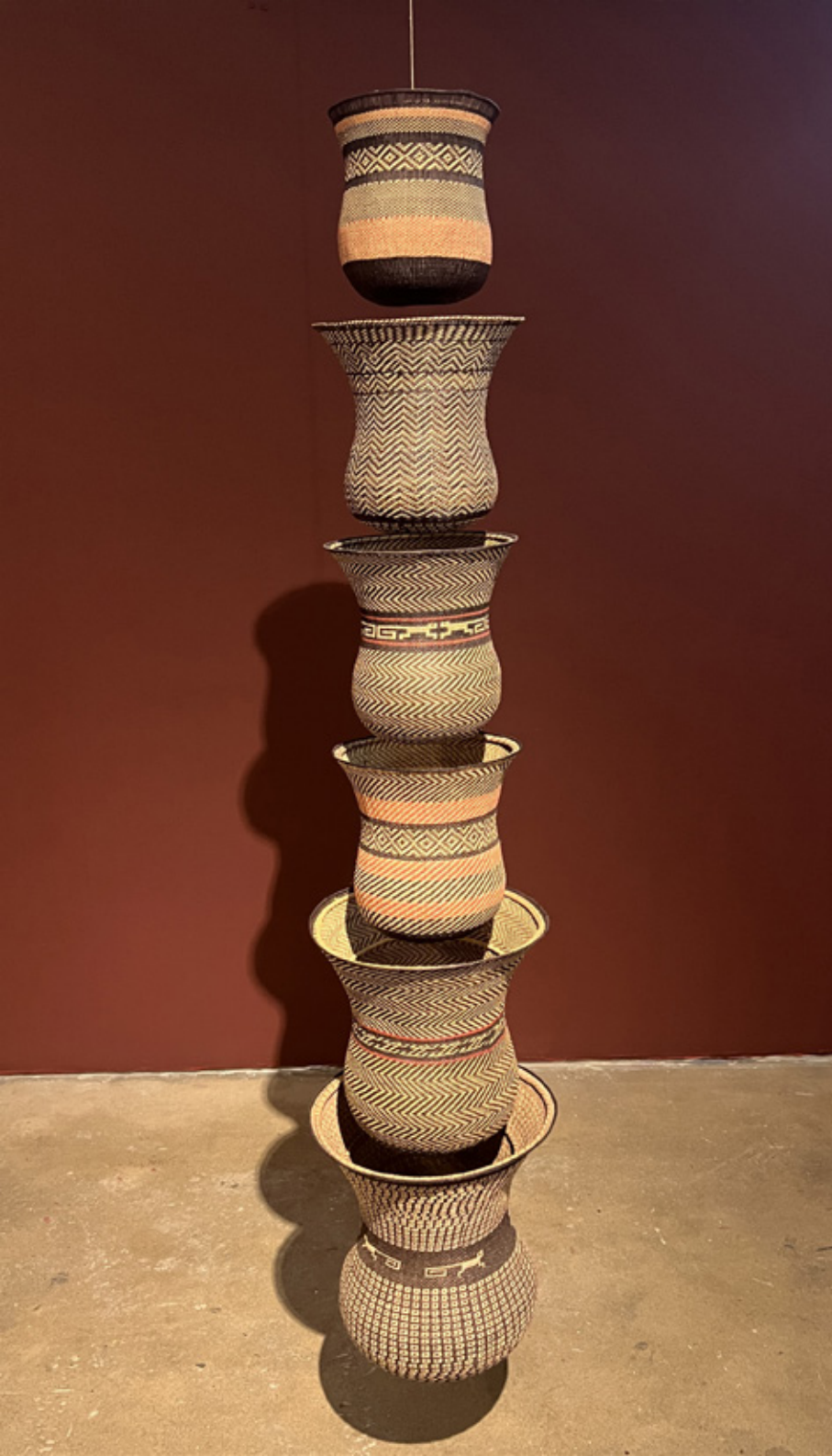
No'ono Kajünñanko'omo (Cielos del universo), 2026. Tejido a mano, bejucos teñidos con tintes naturales. Medidas variables.