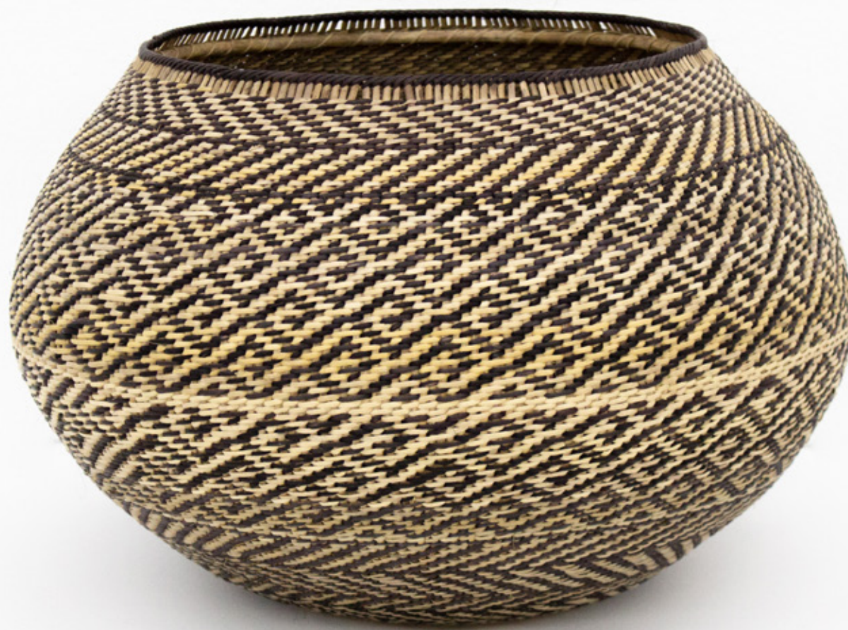
Jöjö , 2026. Tejido a mano, bejucos teñidos con tintes naturales. 25 x 26 cm. [No disponible]