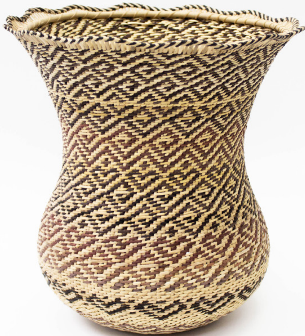
Wíwa, 2026. Tejido a mano, bejucos teñidos con tintes naturales. 25 x 24 cm.