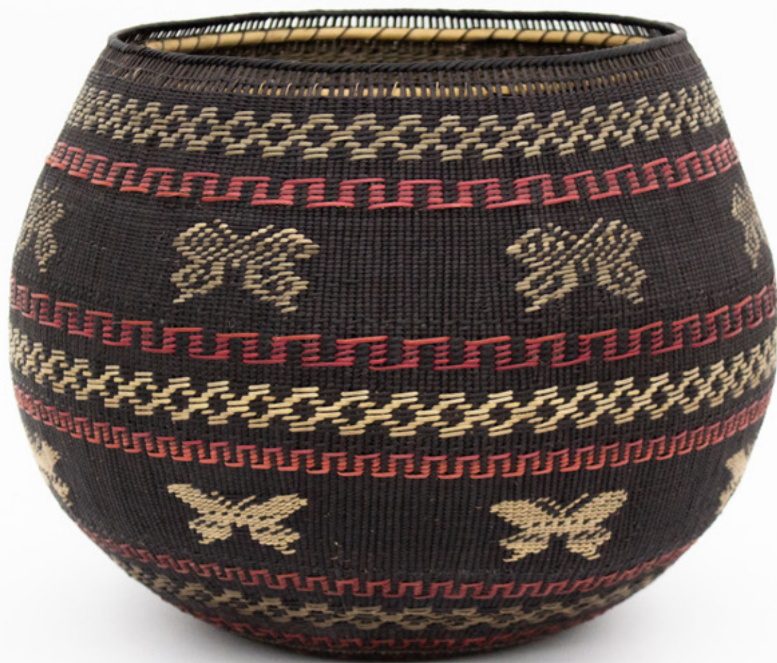
Jöjö, 2026. Tejido a mano, bejucos teñidos con tintes naturales. 25 x 24.5 cm.