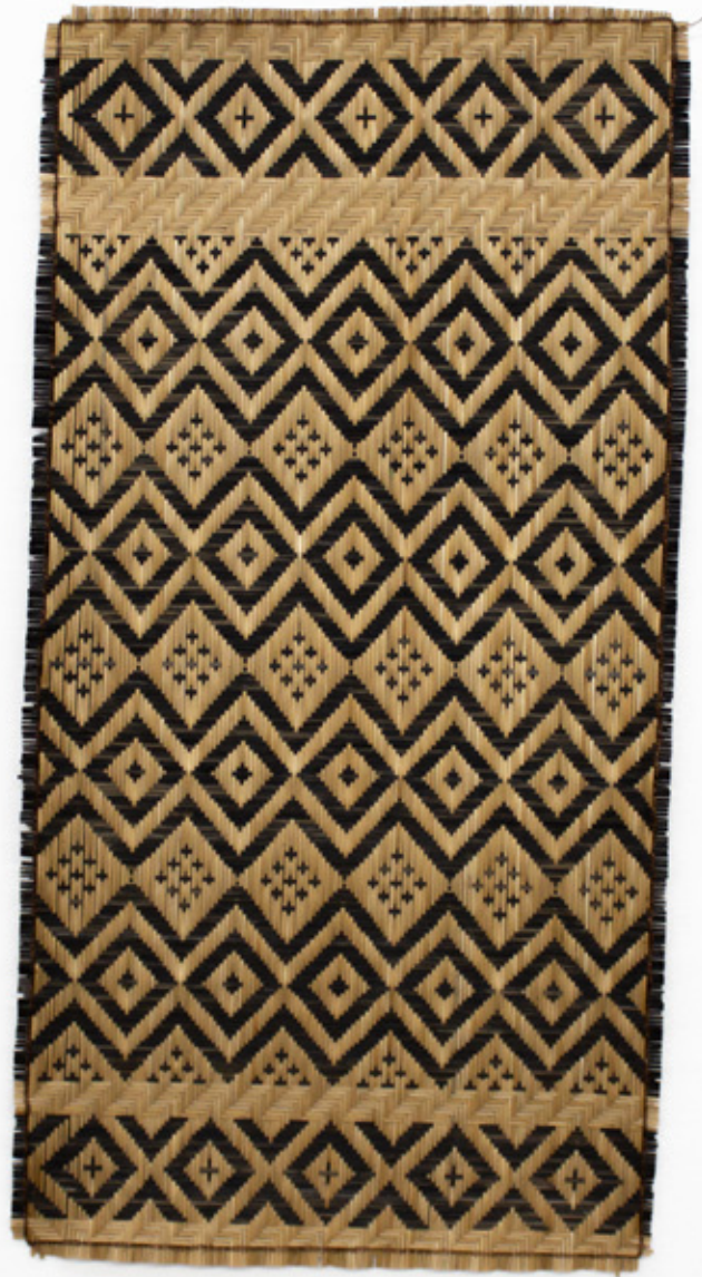
Shamii / Tejer raíces, 2026. Tejido a mano, bejucos teñidos con tintes naturales. 107 x 53 cm.