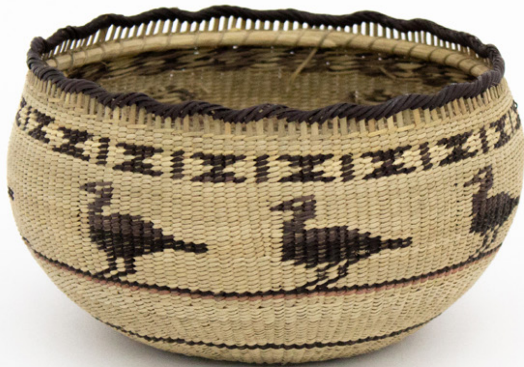
Jöjö, 2026. Tejido a mano, bejucos teñidos con tintes naturales. 10 x 15 cm. [No disponible]