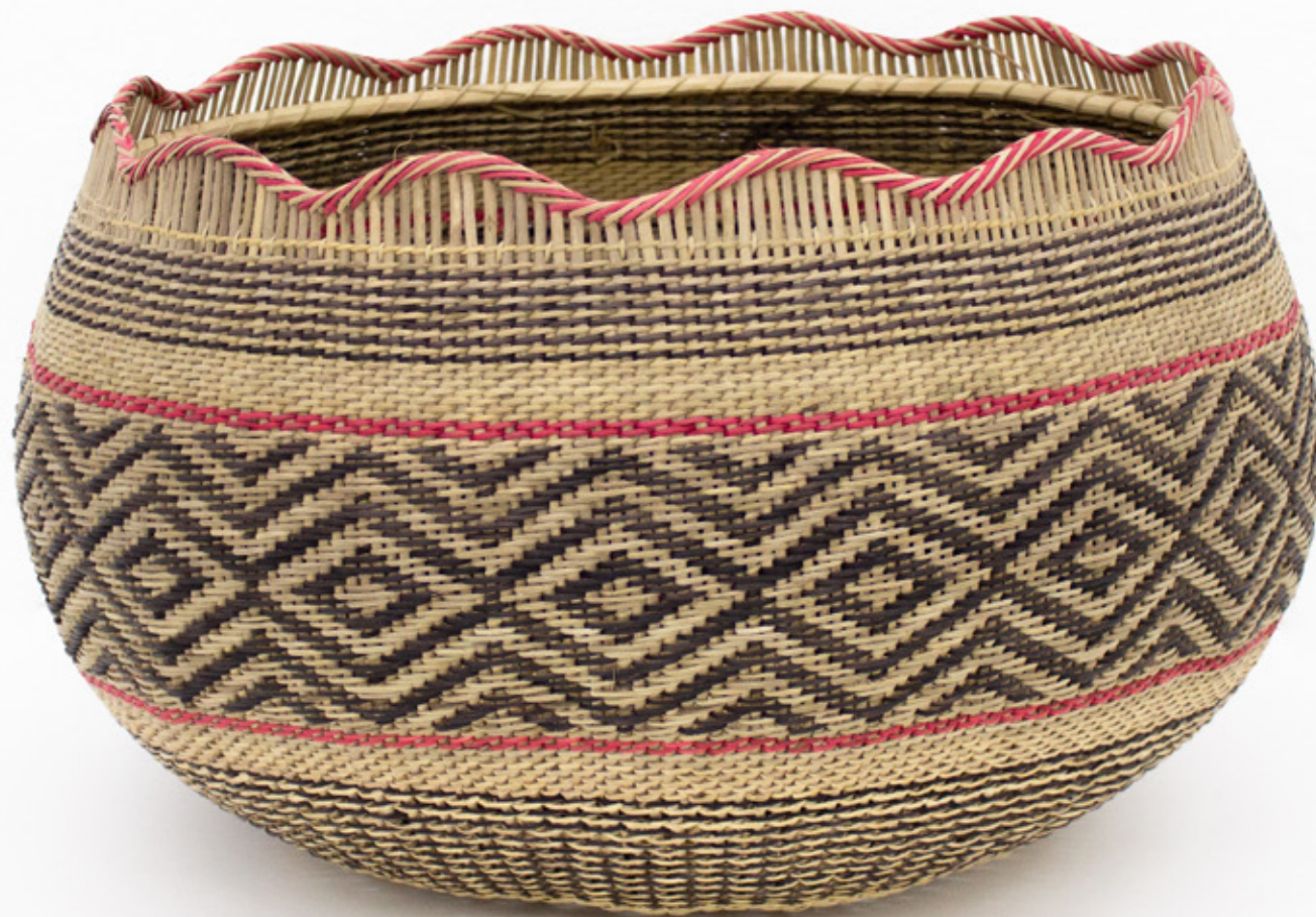
Jöjö, 2026. Tejido a mano, bejucos teñidos con tintes naturales. 27 x 37.5 cm.