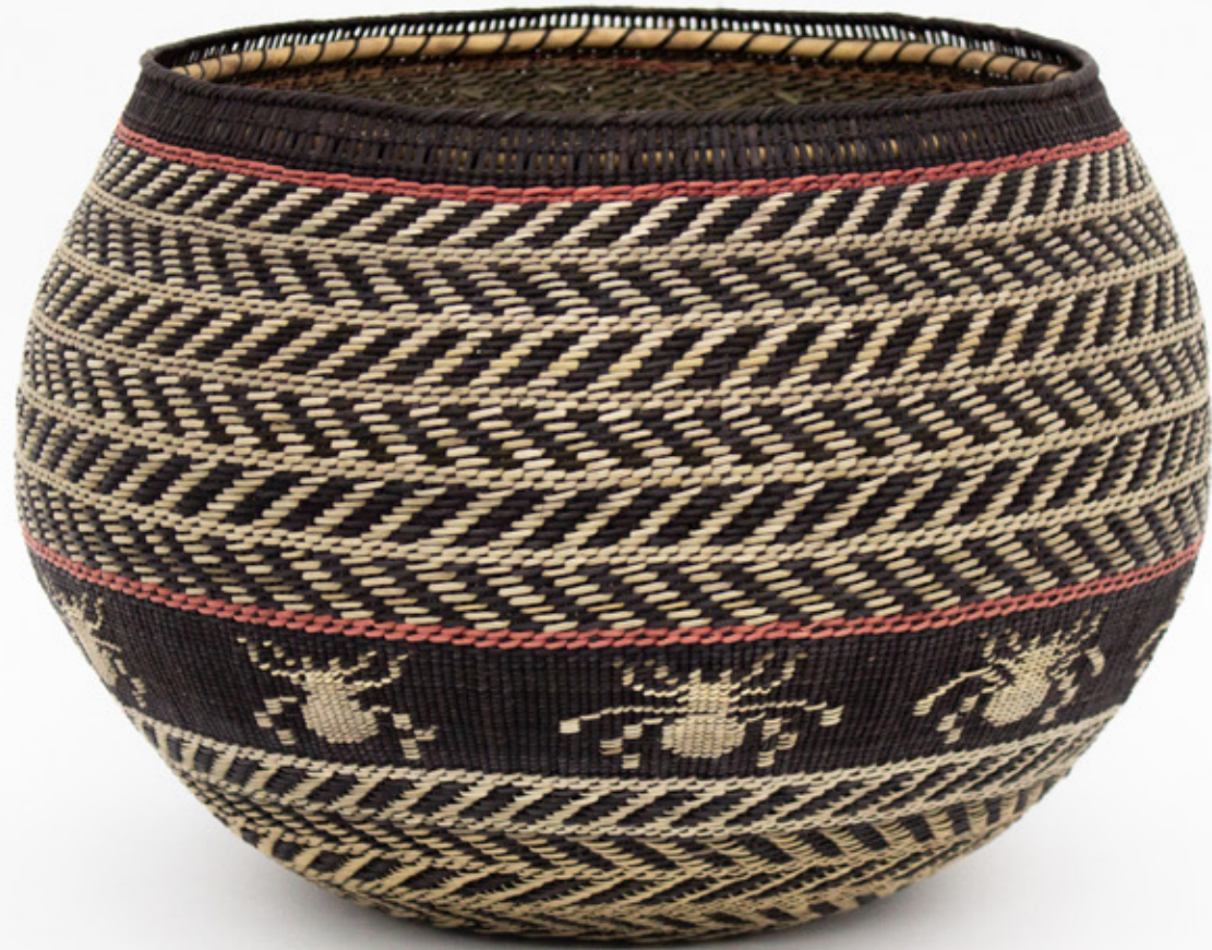
Jöjö, 2026. Tejido a mano, bejucos teñidos con tintes naturales. 24 x 25 cm.