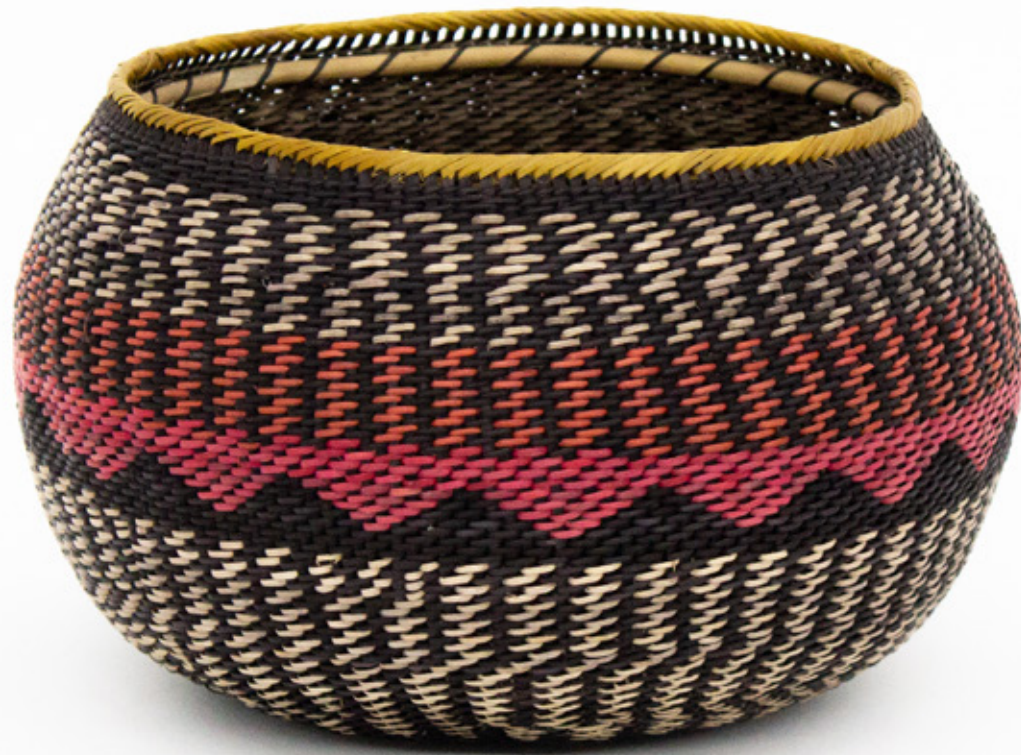
Jöjö , 2026. Tejido a mano, bejucos teñidos con tintes naturales. 13 x 17 cm. [No disponible]