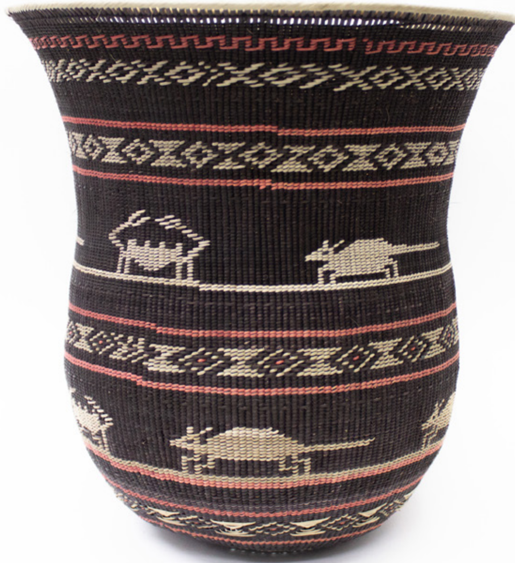
Wiwa, 2026. Tejido a mano, bejuco teñidos con tintes naturales. 31 x 30 cm.