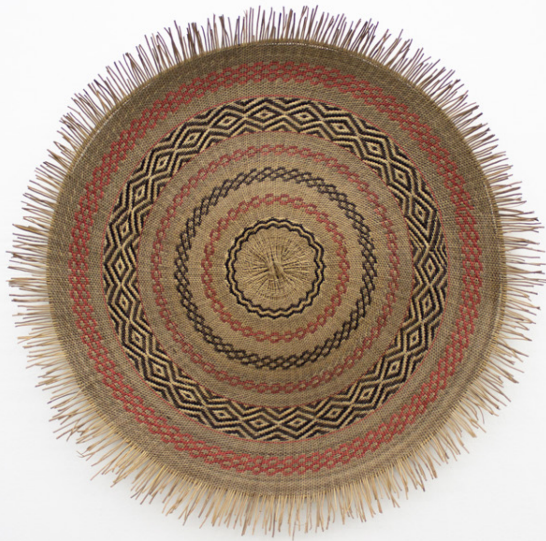
Sol / Shii , 2026. Tejido a mano, bejucos teñidos con tintes naturales. 110 cm Ø.