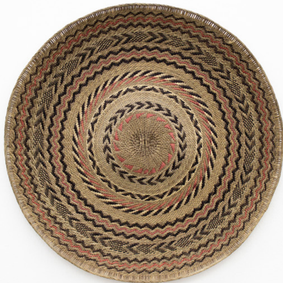
Sol / Shii , 2026. Tejido a mano, bejuco teñidos con tintes naturales. 67 cm Ø.