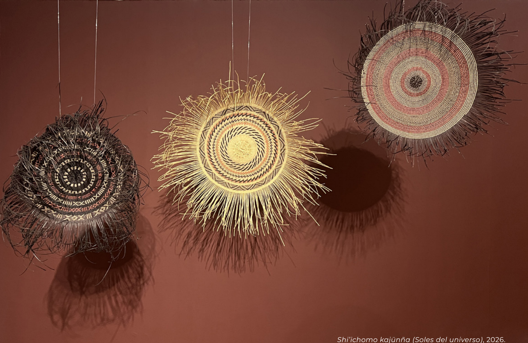
Shi'ichomo kajünña (Soles del universo), 2026. Tejido a mano, bejucos teñidos con tintes naturales. 80 cm Ø / 100 cm Ø / 75 cm Ø.