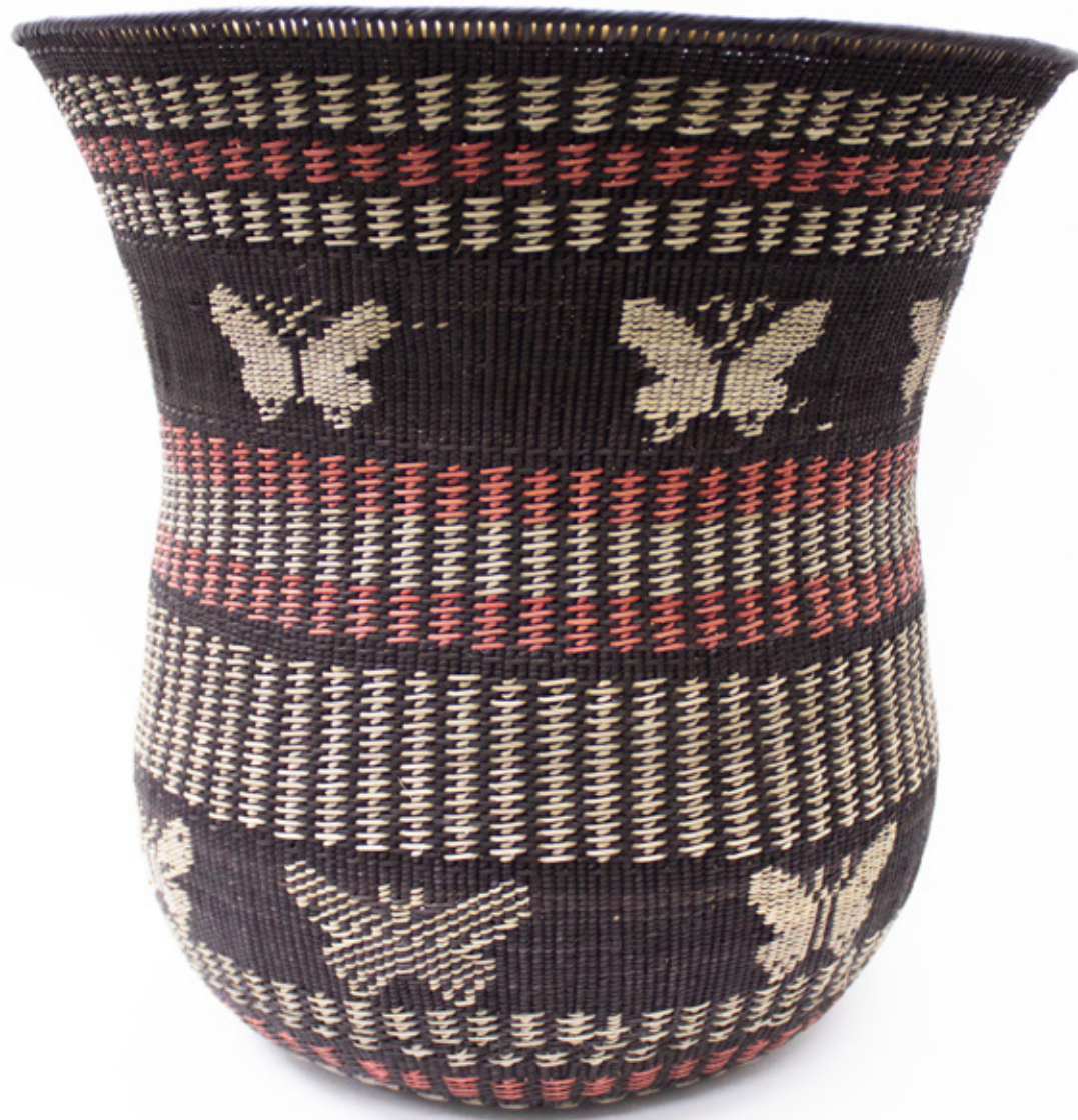
Wiwa, 2026. Tejido a mano, bejucos teñidos con tintes naturales. 37 x 38 cm.