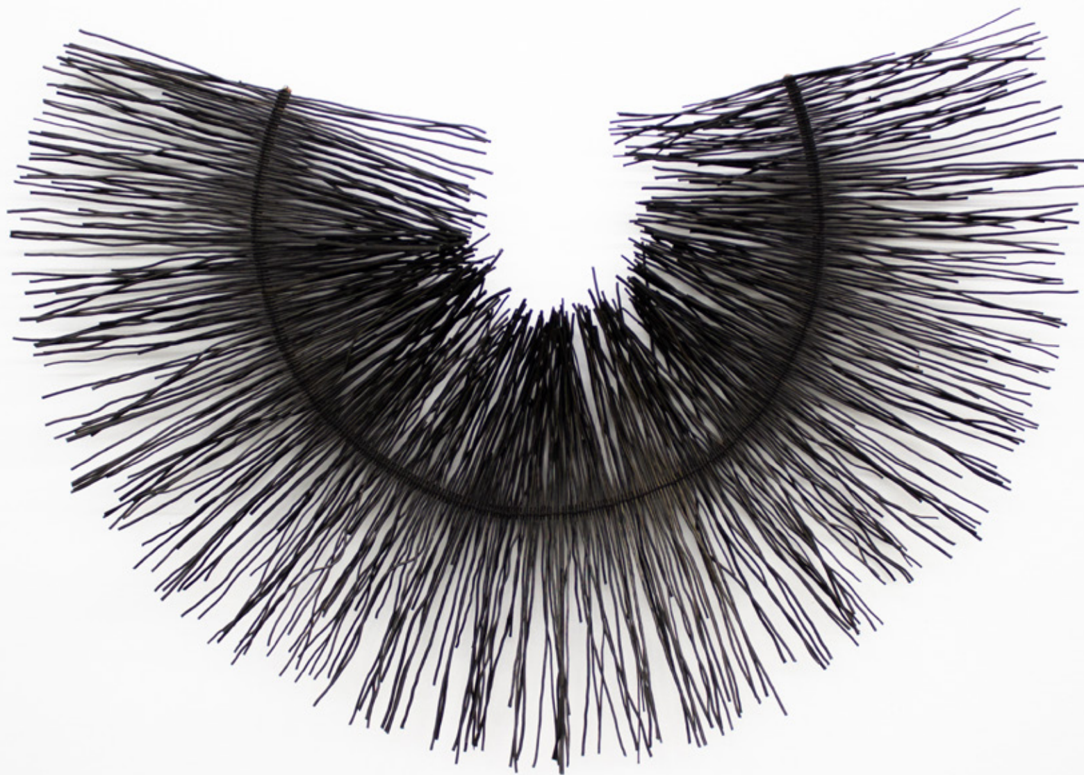
Yademodu / Alas , 2026. Tejido a mano, bejuco teñidos con tintes naturales. 82 x 150 cm.