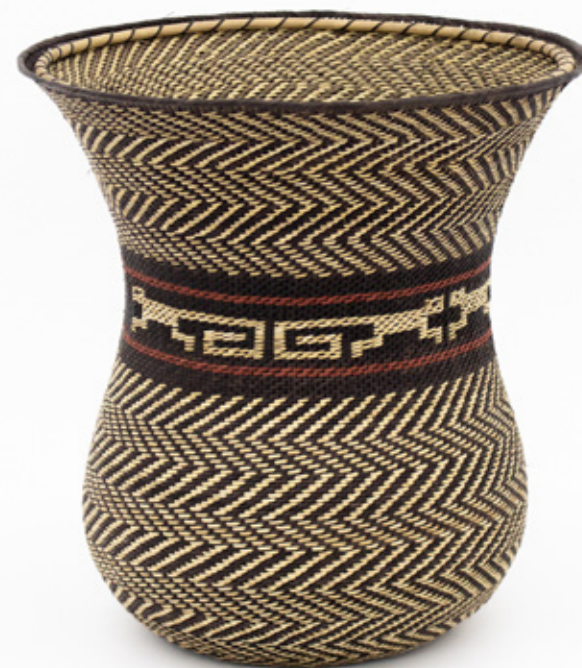
No'ono Kajünñanko'omo (Cielos del universo), 2026. Detalles.