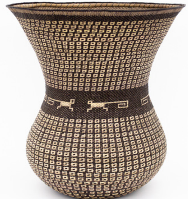
No'ono Kajünñanko'omo (Cielos del universo), 2026. Detalles.